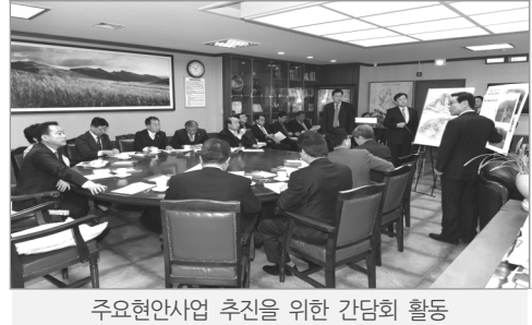
주요현안사업 추진을 위한 간담회 활동