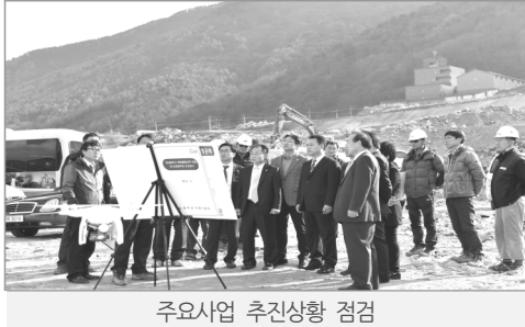
주요사업 추진상황 점검