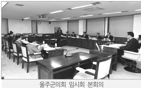
울주군의회 임시회 본회의