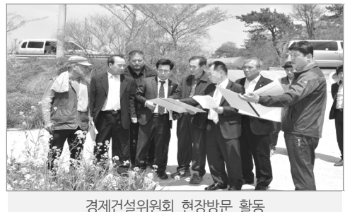
경제건설위원회 현장방문 활동