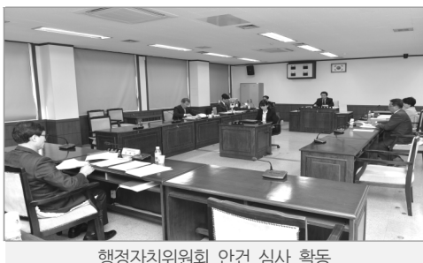
행정자치위원회 안전 심사 활동