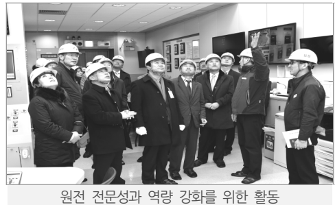
원전 전문성과 역량 강화를 위한 활동