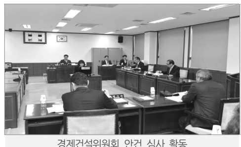
경제건설위원회 안전 심사 활동