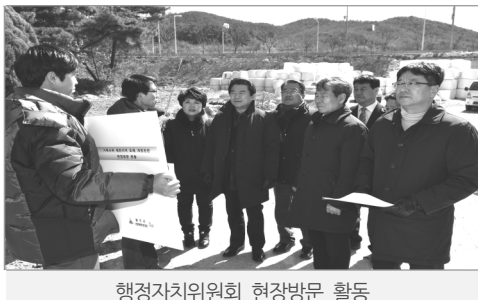
행정자치위원회 현장방문 활동