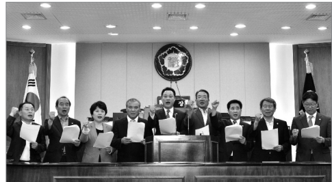
원전해체기술 종합연구센터 유치 결의