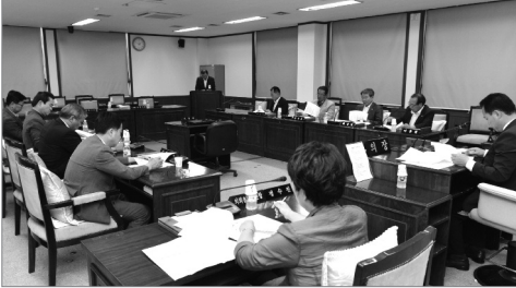
주요현안 논의를 위한 경례간담회