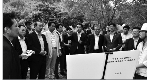
반구대암각화 카이네틱 댐 공사현장 방문