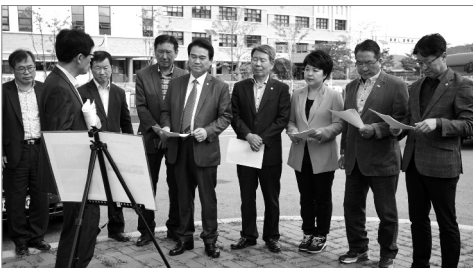
행정경제위원회 현장방문 활동