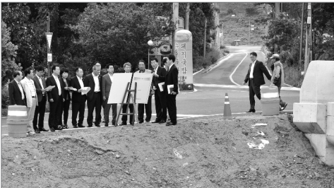
수해 복구 현장 방문