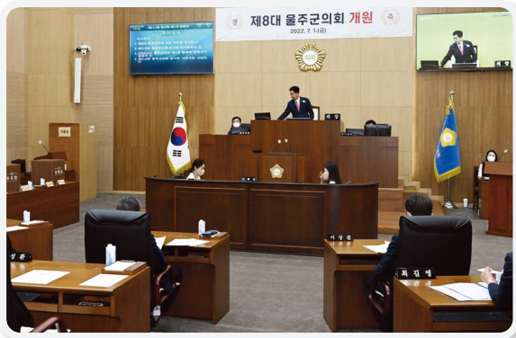
제8대 울주군의회 개원식(07.01.)