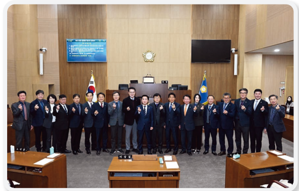
제218회 제2차 정례회 제4차 본회의(12.20.)