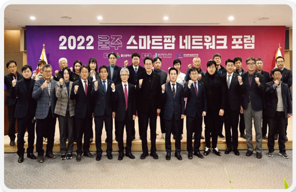
울주 스마트팜 네트워크 포럼(12.09.)