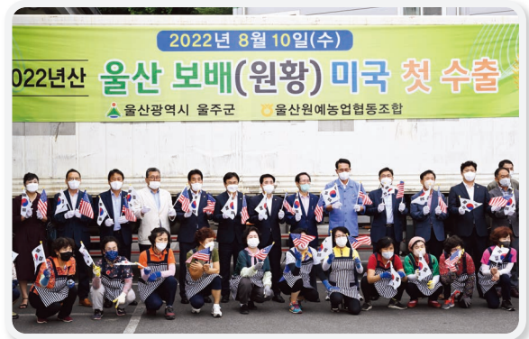
울산 보배 미국 첫 수출 환송행사(08.10)