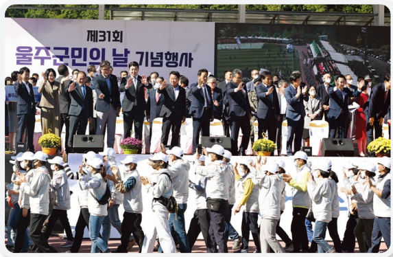
제31회 울주군민의 날(09.24.)